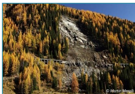
Felsgleitung zerstörte Lawingalerie, Osttirol, 2013