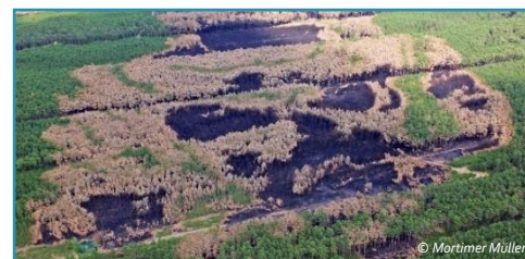
Waldbrand in Neunkirchen, Niederösterreich, 2013