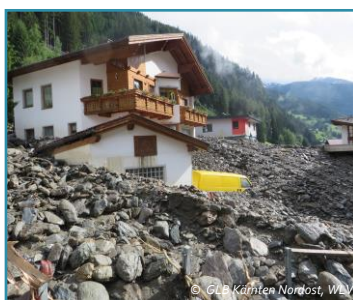
Mure in Afritz, Kärnten, 2016